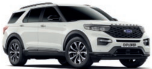
Oxford White †