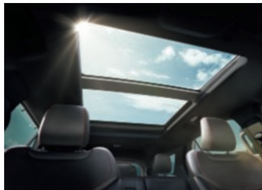
Kétpaneles, elektromos működtetésű panorámatető