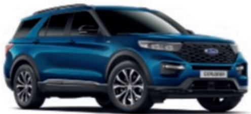
Atlas Blue †

Színezett áttetsző fedőlakk metálfényezés*