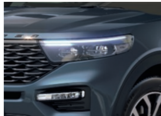
LED fényszórók sportos elsötétítéssel