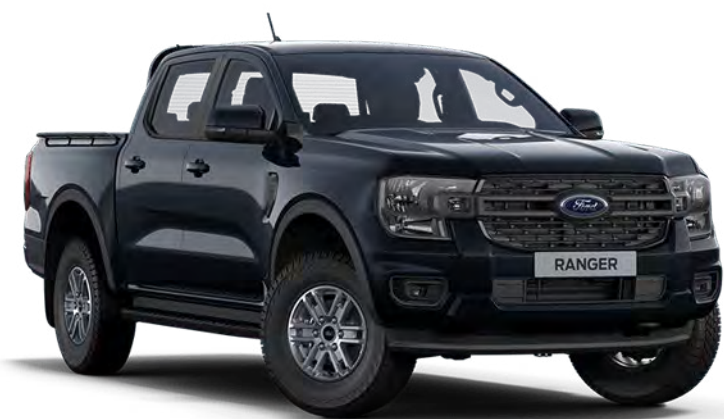
Agate Black †† Metálfényezés