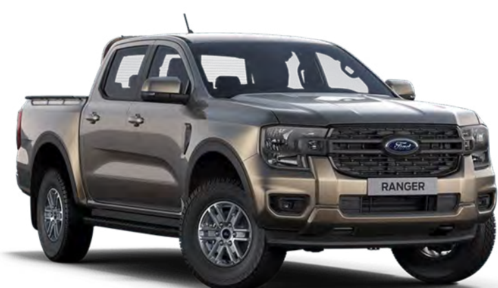
Diffused Silver ††† Metálfényezés