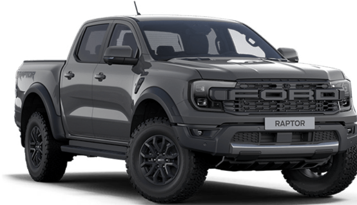
Conquer Grey ††† Alapfényezés