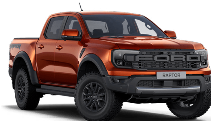
Sedona Orange † Metálfényezés