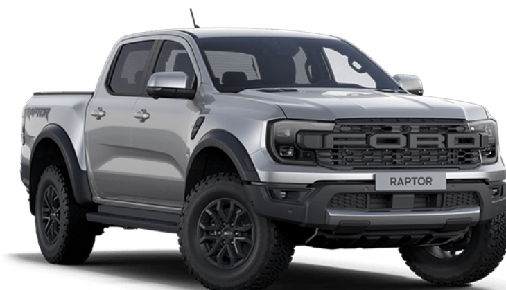
Aluminium Metallic † Fashion metálfényezés