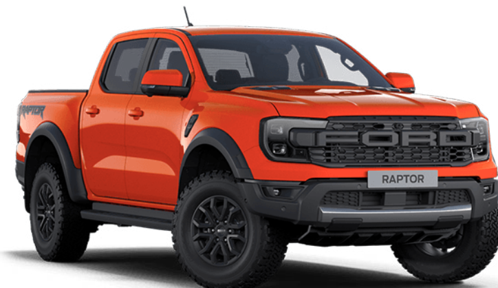
Code Orange † Alapfényezés

Megjegyzés A járműveket ábrázoló képek célja kizárólag a karosszériaszínek illusztrálása, és előfordulhat, hogy nem teljesen tükrözik a valóságot. A katalógusban látható karosszéria- és kárpitszínek az alkalmazott nyomdatechnikai eljárások miatt eltérhetnek a valóságos színektől. Egyes karosszériafényezések opcionálisan, felárért rendelhetők.